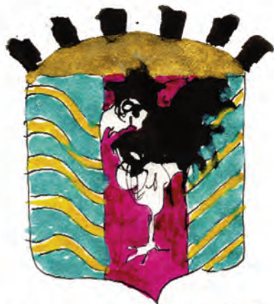
EXPRESS INUTILE EN RETARD