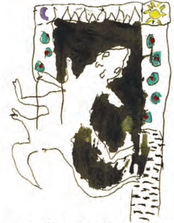
A.C. BLESSED SALAMANDERS