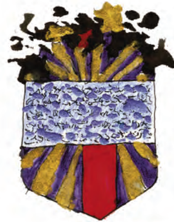
BORUSSIA KUGEL RUNDE NULL