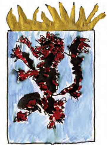
ENTENTE THÉLEMITE DE MYRELINGUE