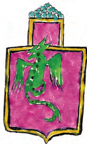
NO BEAT WANDERERS