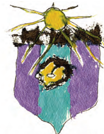
OLYMPIC J'ÉTAIS CIGARE