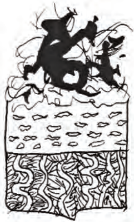
HARD BOILED OLYMPIC