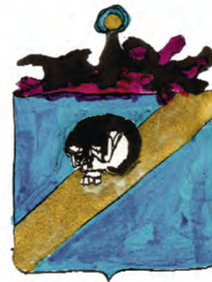
A.S. DÉLINQUANCE ABSTRAITE