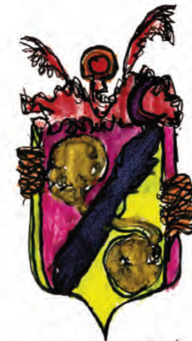
OLYMPIC LES FUMISTES IMPERIAUX